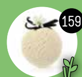
Vanille Eis 1,50