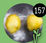
gebackene Banane mit Honig 3,50